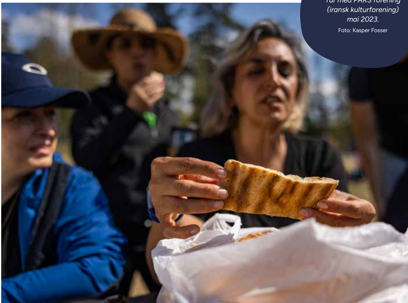
Tur med PARS forening (iransk kulturförening) mai 2023.

Nettsiden turmat.no er en ressurside der organisasjoner og andre kan hente inspirasjon, eksempler og tips til bruk av Turmat fra hele verden som et inkluderingsverktøy. Utover egne kanaler i Norsk Friluftsliv, samarbeider vi med flere av medlemsorganisasjonene om innhold på Turmat fra hele verden i deres kommunikasjonskanaler, for eksempel KFUK-KFUM-speiderne, 4H, Speiderforbundet, DNT og Norges Jeger- og fiskerforbund. I eksterne media har vi fått innhold både i Utrop flerkulturelle avis, flere ulike lokalaviser og på radio. Flere av disse oppslagene var i forbindelse med Turmat fra hele verden-dagen.